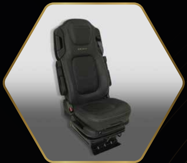
Select-Sitze mit feinen bronzefarbenen Steppnähten