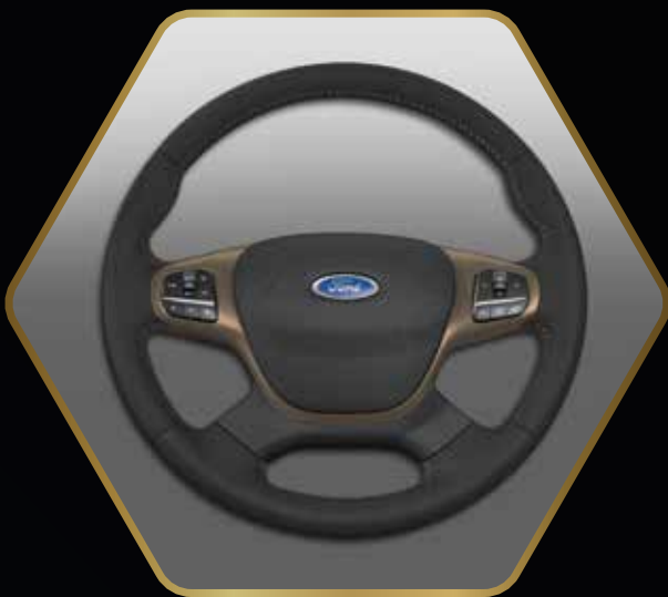
Select-Lenkrad mit feinen bronzefarbenen Steppnähten