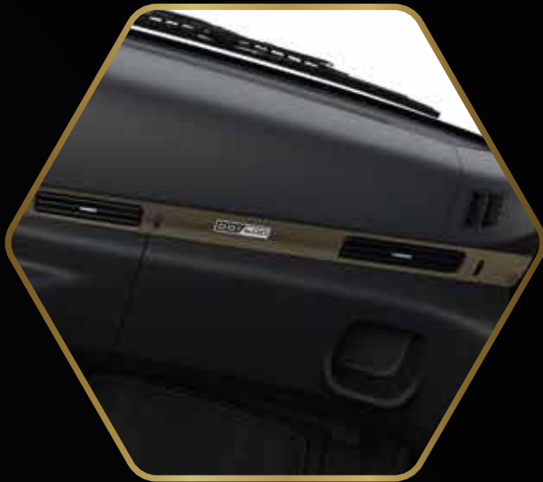
Bronzefarbenes Dekorteil & Select Seriennummer 1 – 400