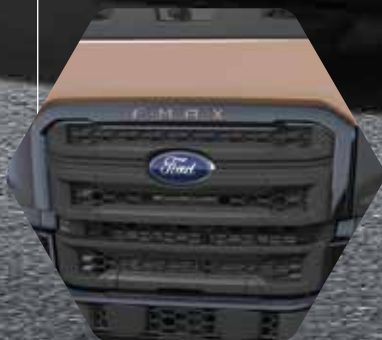
Bronzefarbener F-MAX Schriftzug