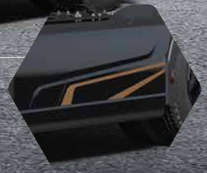
Seitenverkleidung mit bronzefarbenen Dekorakzenten